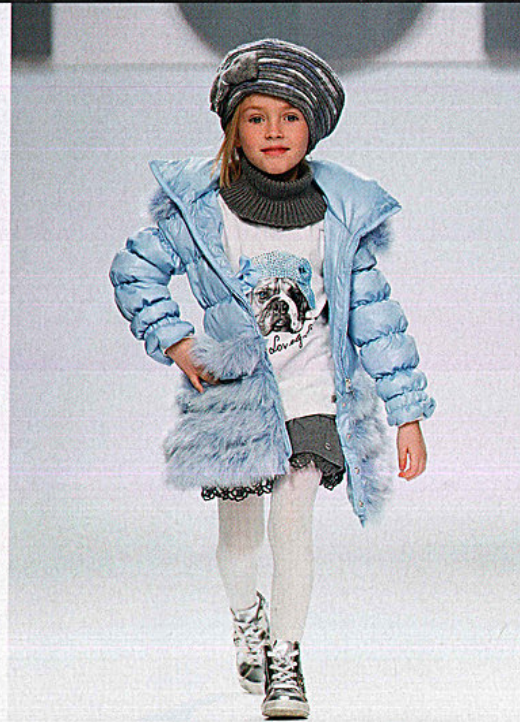
I colori del ghiaccio per il piumino con bordi in pelliccia Fun&Fun, indossato sulla T-Shirt gioiello.