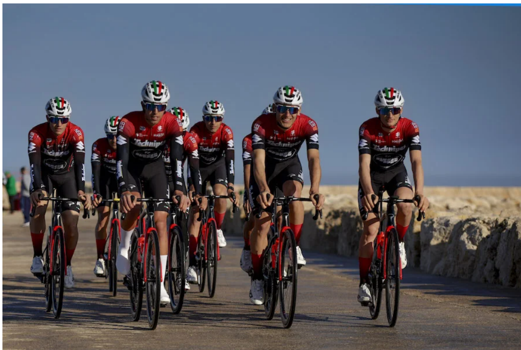
Il Team Technipes #inEmiliaRomagna in allenamento con i loro caschi Salice