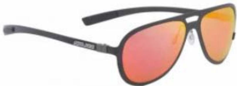
Occhiali da sole in fibra di carbonio Cpivot by Salice Occhiali

Fascino hi-tech in chiave lifestyle quello di Salice Occhiali, leader dell'accessorio sportivo Made in Italy da quasi un secolo, e del suo Cpivot. Cosa rende unico questo modello? Oltre alla linea classica e alla fibra di carbonio a spiccare è il suo peso piuma. Parliamo di soli 16 grammi di tecnologia. Una volta indossati gli occhiali sono impercettibili: è possibile dimenticarsene. Assicurano infatti estrema leggerezza e massimo comfort allo stesso tempo. Non è tutto.