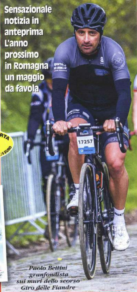
Paolo Bettini granfondista sui muri dello scorso Giro delle Fiandre

Sensazionale notizia in anteprima L'anno prossimo in Romagna un maggio da favola